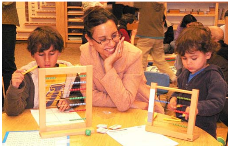
Arriba y abajo: Noche de Matemáticas atrajo a fans de todas las edades!